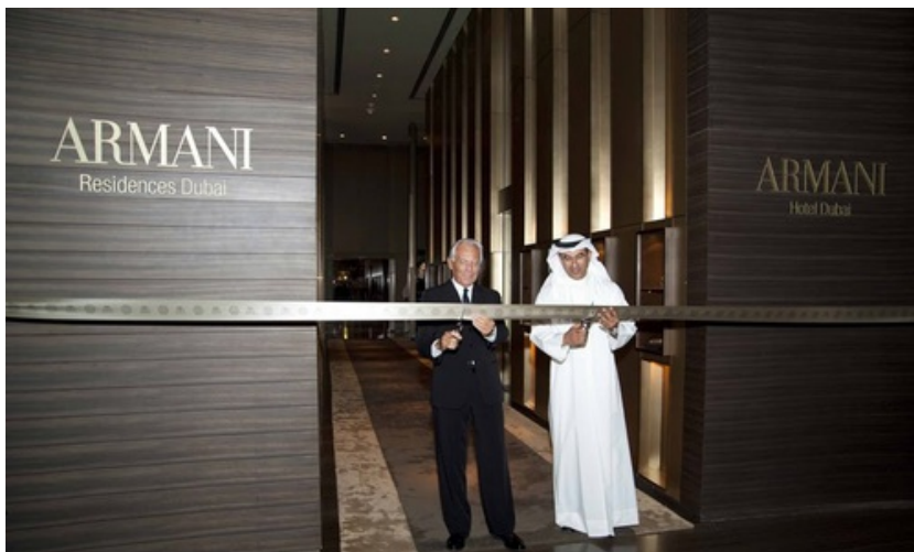
Inaugurazione dell'Armani Hotel Dubai